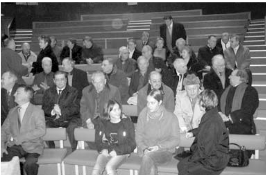
Actifs, Retraités, Membres du foyer de Cachan étaient présents pur cette cérémonie