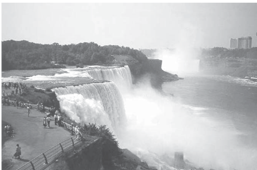
Les chutes du Niagara

Le groupe a rejoint la France avec des images, des odeurs et des sons plein la tête et de se poser la question rituelle : « où et quand l'an prochain, ». La réponse un peu plus tard.